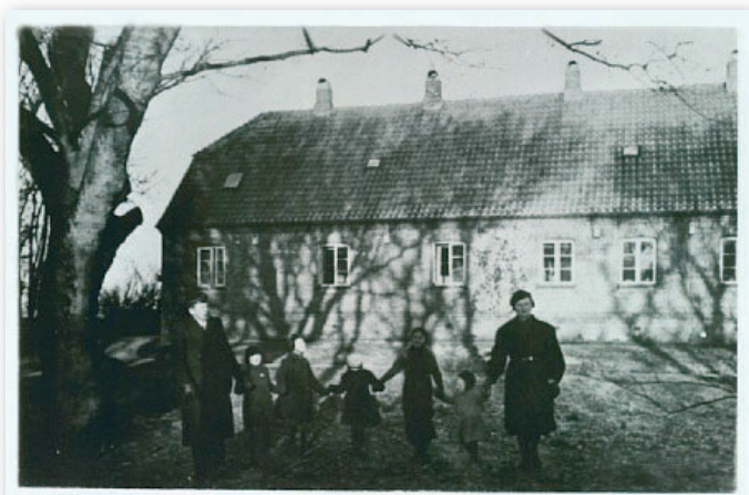
Hele familien Munk i Vedersø præstegårdshave.

Vi valgte ikke kirken fordi det er det alle gør. Vi valgte kirken, da det er et sted hvor vi begge føler os hjemme. Vi ønskede ikke kun at blive viet for vores familie og venner, men også for dem som vi havde taget afsked med igennem livet.