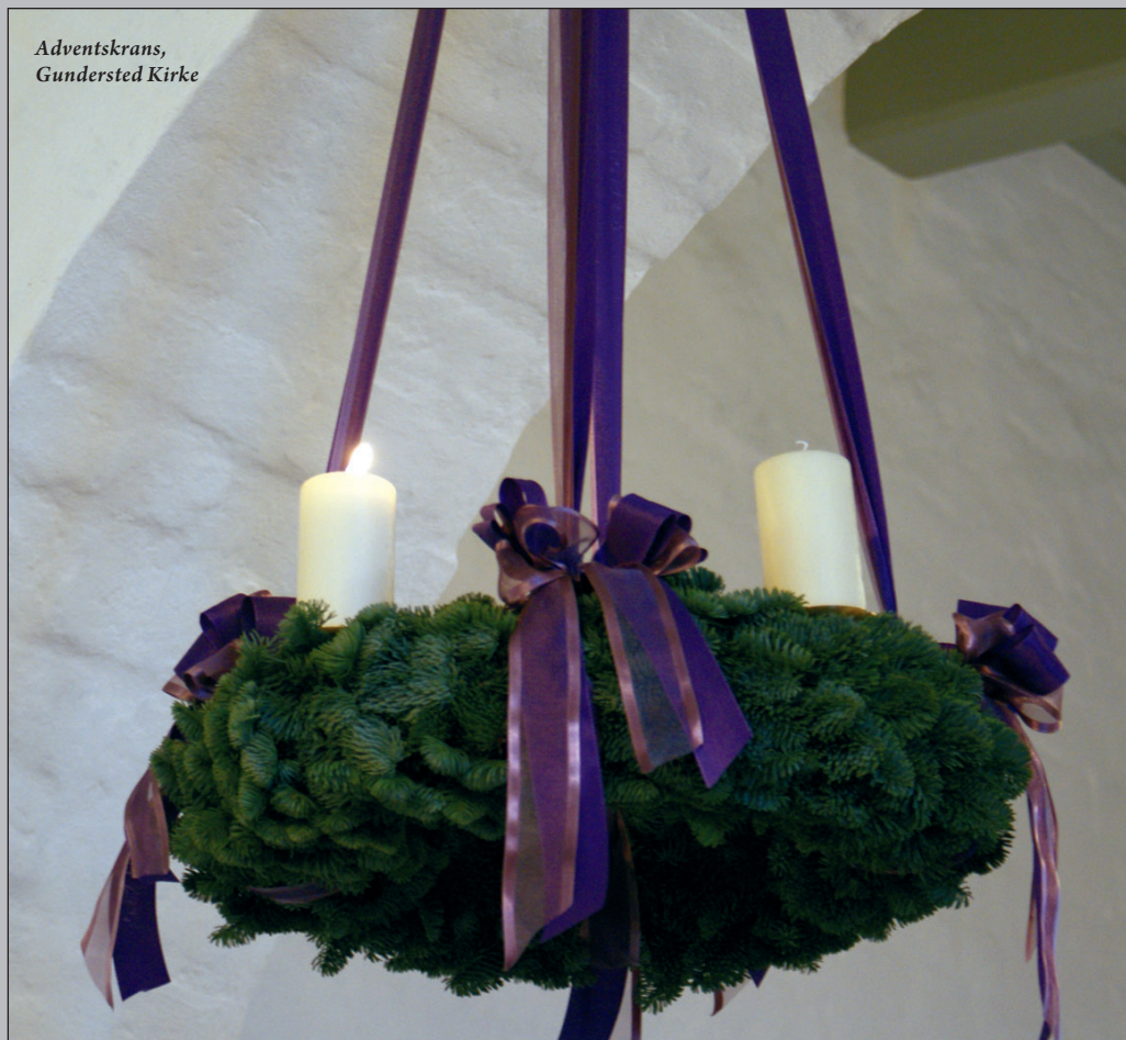
Adventskrans, Gundersted Kirke